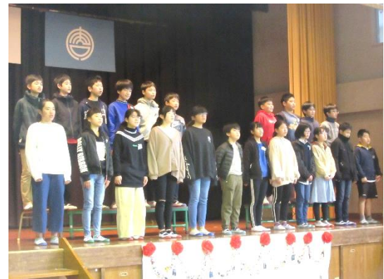
【6年生：お礼の劇と歌】