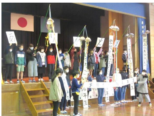
【5年生：くす玉メッセージ】