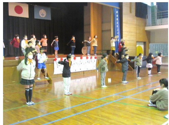
【2年生：歌とオリジナルダンス】