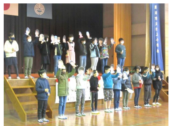
【4年生：感謝を伝えるかえ歌】